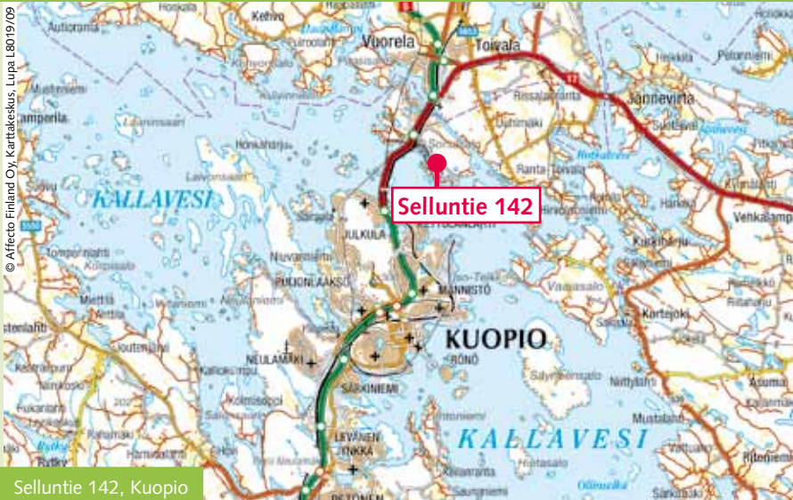
Selluntie 142, Kuopio

Käsittelykeskus sijaitsee VT 5:n varrella Sorsasalossa, 8 km Kuopion keskustasta pohjoiseen. Sorsasalossa noudetaan rampista nro 72 ja käännetään Savon Sellun suuntaan.